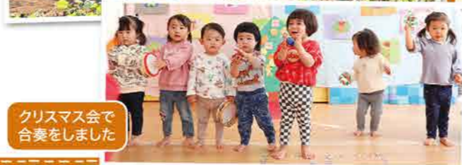
クリスマス会で合奏をしました