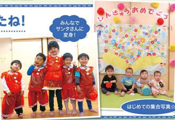
みんなで サンタさんに 変身!

4月は新しい環境やクラスにドキドキしたり、ワクワクしたりしていましたね。1年間を振り返ると、遊びや生活の中でたくさんの経験をして、みんなとっても成長しました。お着替えやなわとびが出来ようになって「せんせい、みてみて!」とキラキラの笑顔で教えてくれたこと、とても嬉しかったよ。難しくてくじけそうになっても、諦めずにがんばる姿がとても素敵でした。みんなが毎日少しずつ成長していく姿を見せてくれて、ありがとう。