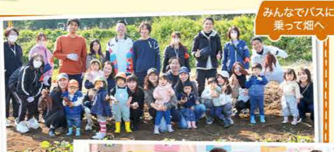
みんなでバスに乗って畑へ

子どもたちの楽しい思い出が沢山つまった月島園は、約20年間の運営を経て、2026年度4月から認可HARUMI保育園へと移行します。今年度はピノファームで育てた野菜を親子で収穫体験したり、給食で出た野菜の種やヘタをプランターに植える事で、子どもたちの野菜への興味の幅が広がりました。また、春から練習してきた合奏をクリスマス会で発表することで、音に合わせて楽器を鳴らす姿に成長を感じました。これまでの間、たくさんの子どもの成長を間近で見られる事を嬉しく思い、今後も新たな楽しい思い出を作っていきたいと思ひます。