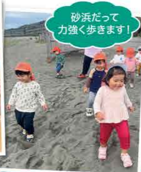
砂浜だって力強く歩きます!

4月から新しいクラスが始まって、あっという間に3月だね。夏は豪快に水遊び!夏祭りではゲームをしてかき氷を食べたね!秋には運動あそびの会でお友だちと楽しく体を動かして、冬はおたのしみ会で頑張ってきたことをお父さんやお母さんに見てもらったね。保育園で色々なことを経験して、できることが増え、優しい気持ちも育ち、みんながどんどん素敵なお兄さんお姉さんになっていくことが、とても嬉しいです!先生は、毎日「今日はどんな楽しいことがあるかな?」と、みんなと会えるのを楽しみに保育園に来ています。今年も一緒にたくさん遊び、楽しく過ごそうね!年長のお友だちは、卒園しても保育園に遊びに来て、小学校の話聞かせてね。