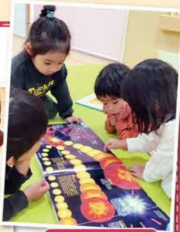
おともだちといっしょに