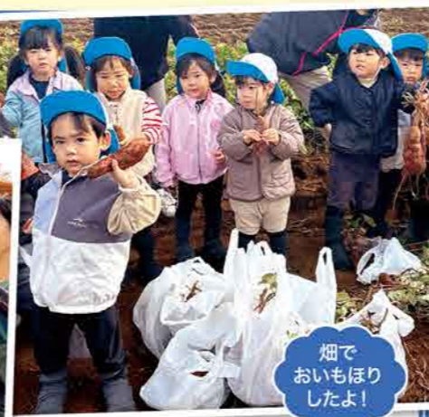
畑でおいもほりしたよ!