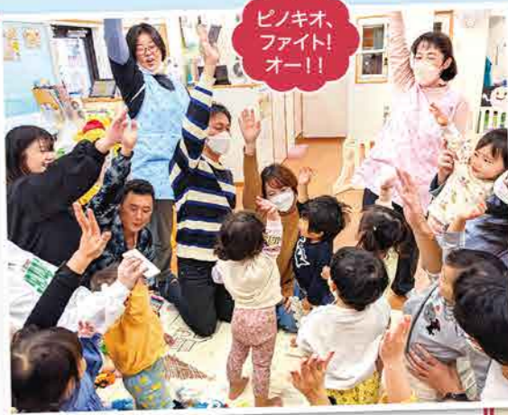
ピノキオ、ファイト!オー!!

この1年間きょうだいのよう過ぎてきた子どもたち。泣いている1歳児に、大好きなぬいぐるみを渡してそっと頭を撫でてあげる2歳児。1年前にはサンタクロースの登場に固まっていたが、1年経って、サンタさんと嬉しそうに握手ができるようになりました。心も身体も大きく成長し、たくさんの笑顔を見せてくれた子どもたち。みんなをそばで見守ることができて嬉しかったです。これからも応援しているよ!ピノキオ、ファイト!オー!!