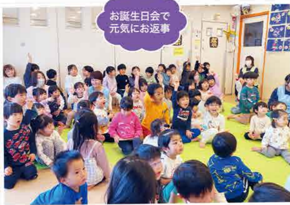
お誕生日会で元氣にお返事