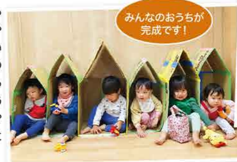
みんなのおうちが完成です!

春、夏、秋、冬...と、その時の季節を感じながらみんなとたくさん遊んだ1年間。みんなの笑顔や成長を見せてもらい、たくさんパワーをもらいました。ありがとう!みんなの中にも、たくさんのお友だちの笑顔や楽しかった思い出が残っていると嬉しいです。4月からはどんなことができるようになるかな?どんな楽しいことが待っているかな?楽しみです。新しいクラスや学校でも、みんなにとって笑顔いっぱいの毎日になりますように!