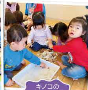
キノコの感触遊び

ジャンボリーやもちつき、日々の遊びの中でみんなの「できた!」に出会えてとても嬉しいです。みんな大きくなったね。井萩保育園に元氣な笑い声が聞こえてきて、楽しい毎日過ごす事が出来ました。素敵な毎日をありがとうございます。これからもみんなの発見や「できた!」事をとても楽しみにしています。