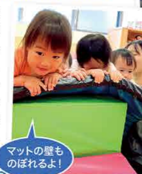
マットの壁ものぼれるよ!

0歳児の子どもたちはお着替えのズボンを自分で脱いでみようしたり、コップ飲みが出来るようになりました。1歳児の子どもたちはパズルに集中したり、マット遊びで手足の力やバランス力が付きました。2歳児の子どもたちは畑で野菜を育て、収穫体験しました。収穫した野菜は「いつもよりおいしい!」ということにも気づきました!この1年色々なことに挑戦し、たくさん笑顔を見せてくれた子どもたち。これからもたくさんチャレンジをしていこうね!