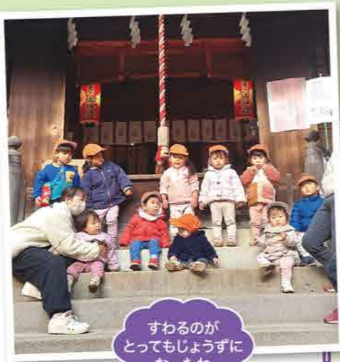
すわるのが とってもじょうず になったね

新しいお友だちができたり、残念ながら途中で別れるお友だちがいたり、今年はお別れの多い一年でした。みんなも戸惑ったり大変なことが多くあったと思いますが、そのたびに子どもたちは自分らしさを忘れずに、元気に乗り越えてくれたと思います。自分たちが優しくしてもらったことを次のお友だちにしてあげて、どんどんお友だちの輪を広げていくみんなのこれからがますます楽しみです。一年間、ありがとうございました!