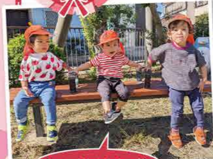
いにとねえねと一緒に

この1年間きょうだいのよう過ぎてきた子どもたち。泣いている1歳児に、大好きなぬいぐるみを渡してそっと頭を撫でてあげる2歳児。1年前にはサンタクロースの登場に固まっていたが、1年経って、サンタさんと嬉しそうに握手ができるようになりました。心も身体も大きく成長し、たくさんの笑顔を見せてくれた子どもたち。みんなをそばで見守ることができて嬉しかったです。これからも応援しているよ!ピノキオ、ファイト!オー!!