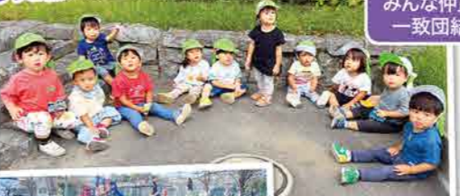
みんな仲良し、 一致団結!!