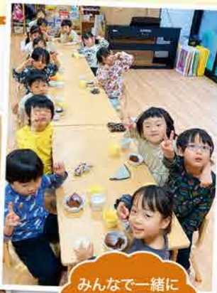
みんなで一緒にたべると楽しいね!