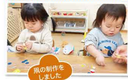
凧の制作をしました!