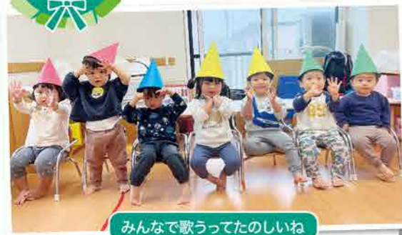
みんなで歌うってたのしいね