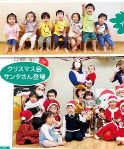
クリスマス会 サンタさん登場

この1年間、たくさんの子どもたちの笑顔に出会う事ができました。春、朝泣いて登園してきた子がいつの間にか好きな遊びを見つけて嬉しそうにした時のニコニコ笑顔。お友だちとおもちゃの取り合いをして貸してくれた時のほかにんだ笑顔。ハロウィンやクリスマス会などの楽しい行事に参加して喜んでくれた時の笑顔。たくさん笑顔にパワーをもらう毎日でした。子どもの笑顔は最高ですね。そしてたくさん笑顔をありがとう。