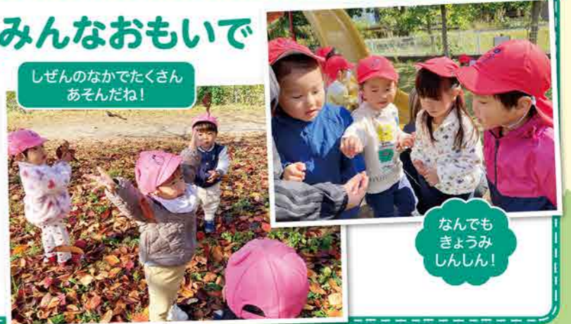
しぜんのなかでたくさんあそんだね!

ほいくえんでたくさんのおともだちとすすなかで、たくさんわらってたくさんあそんで、ときにはおともだちとけんかをしてなみだがでてしまうこともありました。この1ねんかん、いろいろなことをけいけんし、おおきくたくましくせいちょうしましたね。そんなみなさんのすがたをそばでみまもることができて、とてもしあわせでした。これからどんなすてきなおにいさん、おねえさんになるのかたのしみです!