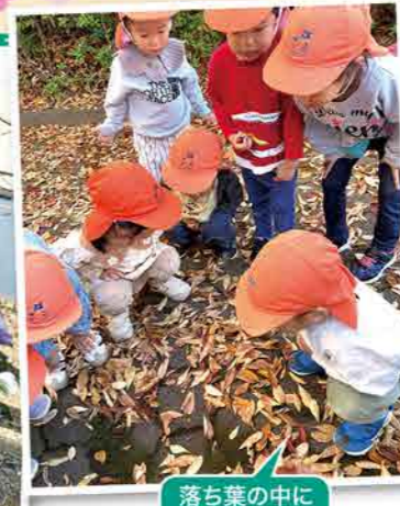
落ち葉の中に虫発見!