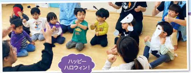
ハッピー ハロウィン!

英語の先生が来た日は、みんなが笑顔になり「グッモーニング」や「ハロー」と挨拶して、公園に行ったり、お部屋でたくさん遊んだね!毎月行われたパーティーでは、その月の行事やイベントに因んだ遊びをして、どんどん英語に興味を持った子どもたち。一年間を振り返ると気持ちを英語にして表現したり、遊びの中でも自然と英語でやりとりをする姿が見られ成長を感じられました。