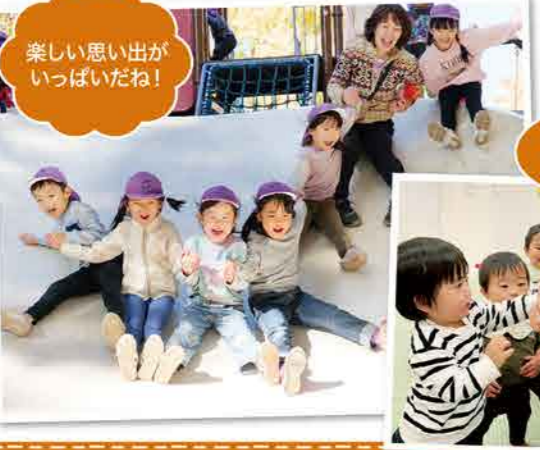
楽しい思い出がいっぱいだね!