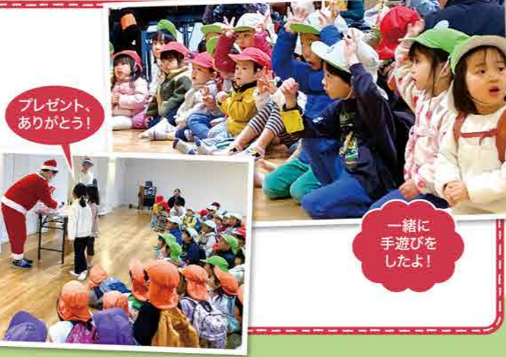
一緒に手遊びをしました!