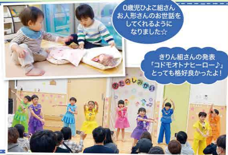
0歳児ひよこ組さん お人形さんのお世話をしてくれるようになりました! ☆

この1年、たくさんの笑顔と成長を見せてくれてありがとう!パパやママと離れなくて泣いた日、お友だちとたくさん笑った日、できなかったことができるようになった日。毎日のひとつひとつが宝物です。緊張したけれど楽しく力を合わせて発表したお楽しみ会。みんなが頑張る姿がとっても素敵で感動しました。みんなのお陰で先生たちも毎日たくさん笑って過ごすことができました。これからもみんなのキラキラ笑顔がたくさん輝きますように!