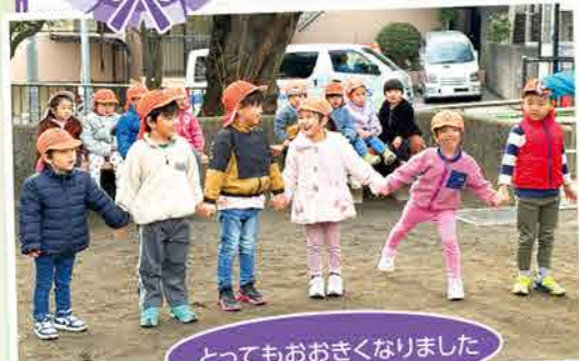
とってもおおきくなりました

新しいお友だちができたり、残念ながら途中で別れるお友だちがいたり、今年はお別れの多い一年でした。みんなも戸惑ったり大変なことが多くあったと思いますが、そのたびに子どもたちは自分らしさを忘れずに、元気に乗り越えてくれたと思います。自分たちが優しくしてもらったことを次のお友だちにしてあげて、どんどんお友だちの輪を広げていくみんなのこれからがますます楽しみです。一年間、ありがとうございました!