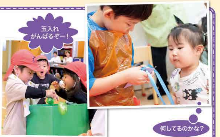
玉入れがんばるぞー!

はじめてのことにドキドキした日、うれしくて笑顔があふれた日、悔しくて涙が出た日。一つひとつの経験を重ねながら、みんなは心も体も大きくなりました。夏まつりやジャンボリー、遠足やおたのしみ会など...と振り返ると、行事や毎日の生活の中で、みんなは心も体も大きく成長しましたね。どれも全てが大切な思い出です。素敵な時間を本当にありがとう。これからも、みんなが自分らしく輝きながら歩いていけることを、心から願っています。