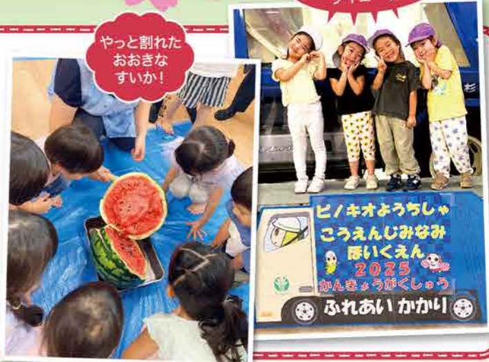
やっと割れた おおきな すいか!

「すいかを割ってみたい!」「ごみパックンやってみたい!」という声から始まった楽しい日々。園長先生に手紙を書いてお願いしたこと、大きなすいかをみんなで力いっぱい叩いたこと、ごみ収集車を見たり仕事体験を試したりしたこと、どれも大切な思い出です。やりたい気持ちをまっすぐ伝えてくれてありがとう。みんな大きくなったね。一年間、素敵な時間をありがとう。