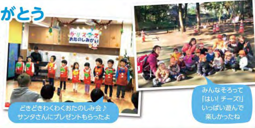
どきどきワクワクおたのしみ会♪ サンタさんにプレゼントもらったよ

ピカピカの園舎での新しい生活がスタートし、みんながドキドキワクワクしていた春から1年。水遊びや季節の行事、ジャンボリーやクリスマスお楽しみ会など、たくさんの「初めて」を一緒に過ごしてきたね。みんなの笑顔が日に日に増えていったこと、できることが少しずつ増えていった1年のこの時間は私たちにとって宝物です。成長した姿や色々な表情、そして何より毎日たくさんの笑顔を見せてくれたことが嬉しいです。みんなありがとう!!