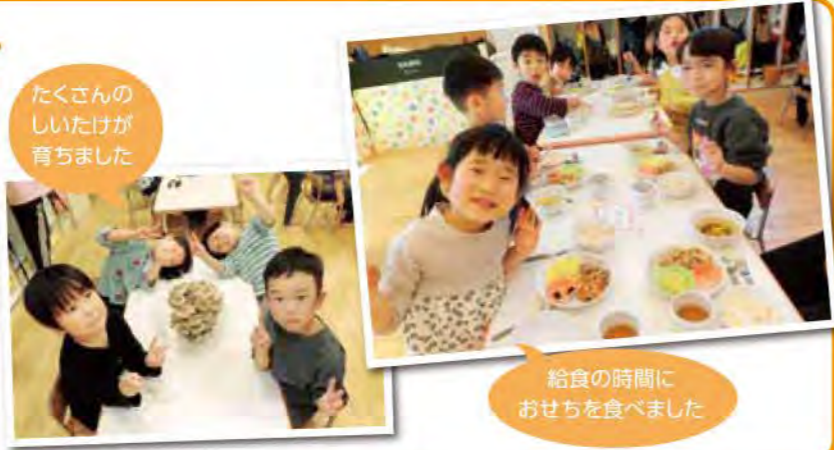
たくさんの しいたげが 育ちました

1年間を通して、様々な食育活動をおこなってきました。アイス作りやきのこの栽培など季節ごとに楽しめるイベントを開催しましたが、特に人気があったのはおせちの食育でした。おせちについての話を子どもたちは楽しそうに聞いており、給食の時間になると「さっきお話ししてくれたご飯だね」と笑顔で完食してくれる子がたくさんいました。日常の中でも「おいしかったよ」と声をかけてくれたり、「お家で作ってみたいよ」と教えてくれると私たちも幸せな気持ちになります。いつもありがとう!