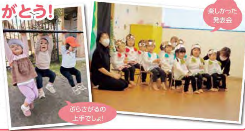
楽しかった 発表会

入園当初泣いていた子どもたちが運動会や発表会等の人前でも堂々と表現するようになり、様々な経験を通してたくましく成長をしました。お外で体を動かして遊ぶのが大好きな稲城園のお友だち。「よーいどん!」と言って元気にかけっこやどんぐり等の木の実を探してみんなで見せ合ったり、ごっこ遊びをしたりして楽しかったですね。皆さんの成長をそばで見守ることができて幸せでした。楽しい思い出をありがとう。これからの成長も楽しみにしています。