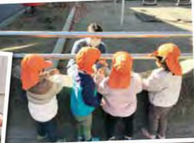
みんなお客様の お店屋さんごっこ。

今回は「1年間ありがとう！」をテーマに、保育者たちから子どもたちへ送る感謝のメッセージや、2023年度を振り返って心に残ったエピソードなどをご紹介します。