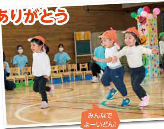
みんなで よーいどん！

毎朝元気に「先生おはよう！」と声をかけてくれる子どもたち。楽しかった出来事があると、1番にお話して来てくれ、嬉しかったです。子どもたちの元気な声と、可愛い笑顔に、毎日たくさんのパワーを貰いました！そんな子どもたちに、「ありがとう」の気持ちでいっぱいです。