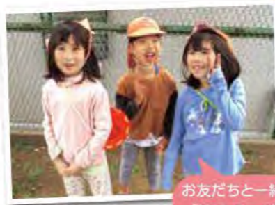
お友だちと一緒に 「はい チーズ!」

4月は、入園・進級と新しい環境にちょっぴり不安な子やワクワクしている子とさまざまな表情を見せていました。春はお友だちや保育者と探検をして、夏は水遊び、秋は虫探しに木の实拾い、冬は体をいっぱい動かして鬼ごっこ、ときにはケンカもしました。遊びを通してたくさんの経験をし心も体も成長した今では、自信に溢れた笑顔でとてもキラキラしています。みんなと過ごした1年間とても楽しかったです。素敵な思い出とたくさんの笑顔ありがとう。