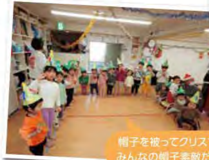
帽子を被ってクリスマス会！ みんなの帽子素敵だったね！

いつもニコニコの笑顔で登園して「おはようございます」と元気な声で挨拶してくれたり、公園で元気いっぱい体を動かして楽しそうにしていたり、みんなたくさん笑ってくれたね。運動会などの行事では真剣な顔で取り組んでいて、上手にできると少し我慢しながらもにっこりと笑っていたね。この1年間たくさんの笑顔を見せてくれて、とってもありがとう！心の中がみんなの笑顔でいっぱいになって、笑顔になったよ！