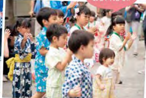
いつもと違う おしゃれして!!