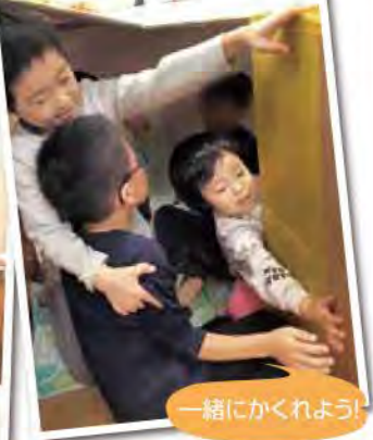
一緒に かかれよう!