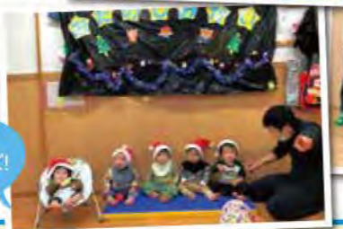
みんな ハイ☆チーズ!