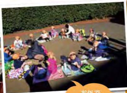
お外で おにぎり食べて おいしかったね！