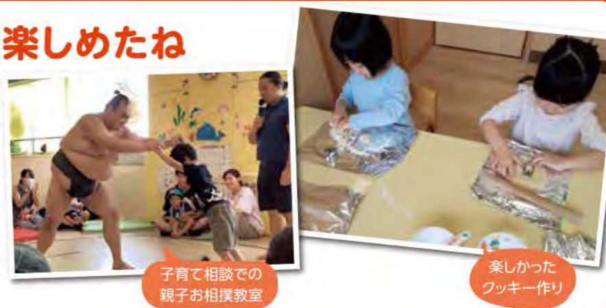
子育て相談での 親子お相撲教室

今年度の子育て相談では「親子お相撲教室」「親子防災教室」とたくさんのことが企画されました。お相撲教室では大きいお相撲さんにビックリしてしまい、お友だちよりもお父さんたちがお相撲を楽しんでいました。食育では「グミ」を作って食べたり(ちょっとかたかったけれど)「お月見団子」を作って飾ったり「七草がゆ」を食べたり季節的なことも経験できました。来年度もたくさんの経験が出来て楽しめていけたらいいなと思っています。