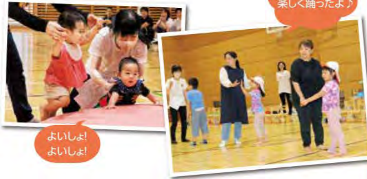
みんなで 楽しく踊ったよ!

今年度は行事にコロナ前の様な活気が戻ってきた1年となりました。特に運動会では久しぶりに全学年での実施となり、0歳児の可愛いレースから4・5歳児さんの素敵なパラバルーンまで、どの競技も笑顔がたくさん溢れていたと思います。一番最後の競技、全員でのダンスをしたり、保育者一同とても楽しみ、みんなの笑顔にパワーをもらえました! 来年度子どもたちはもちろん、みんなが楽しくなるような行事を実施出来るように頑張ります。1年間、ありがとうございました!