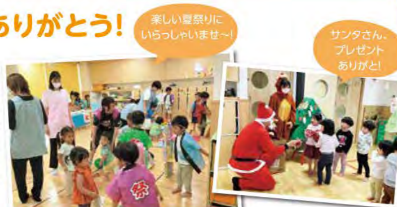
楽しい夏祭りに いらっしやいませ~!