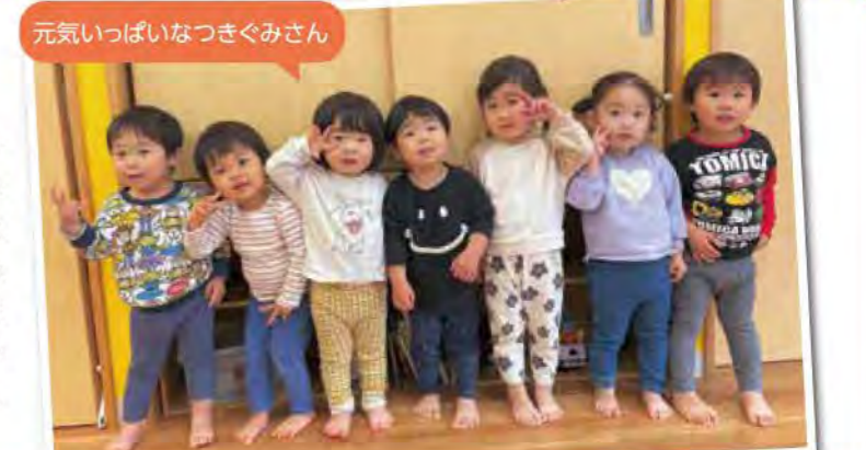
元気いっぱいなつきぐみさん

1年が過ぎ子どもたちも1年前に比べ更に成長しました。ひとりで歩けるようになったり、言葉が増えて文章でお話をしたり、お友だち同士で考えながら遊んだりクラスで成長が目に見えてわかるようになってきました。保育者の名前を覚え駆け寄って来てくれた時にはとても嬉しかった気持ちが昨日のように思います。0歳児、1歳児クラスの子はまた来年も一緒に遊ぼうね。2歳児クラスの子は3月でそれぞれの道に行ってしまうけどまたどこかで会えるといいね。新しい環境でもたくさん楽しんでね。