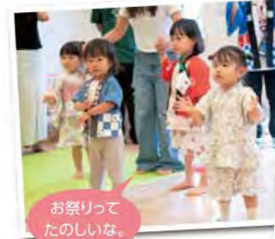
お祭りって たのしいな。

久しぶりにご家族の方を呼んで夏祭りができ、制作やヨーヨー釣り、射的などを楽しむことができました! やっぱりご家族みなさんで楽しむことができるっていいですね!! いつも以上に嬉しい、楽しい気持ちがあふれ出ていて、みんなで楽しい時間を過ごすことができましたね。元気な声、ゆかいな笑い声などが毎日園全体に響いています。お友だちっていいね。家族っていいね。保育園っていいね。たくさんの「いいね。」をありがとう!!