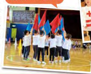
気持ちを1つに! 運動会!

たくさん素敵な時間を一緒に過ごしてくれてありがとう! みんなは、たくさん思い出できたかな? 縁日、ゲームとたくさんの出店があった夏祭り。当日はみんなの目がキラキラしていて、時間が過ぎるのを忘れるくらい楽しめました。盆踊りも素敵でした! カッコいい姿が見られた運動会。かけっこ、遊戯、ソーラン節、堂々披露していましたね! そして、大きく成長した姿が見られた発表会。緊張した様子でしたが、本番はとっともかっよかったです! 一人ひとりが自分のペースで大きく成長できたことを嬉しく思います。素敵な楽しい時間をありがとう!