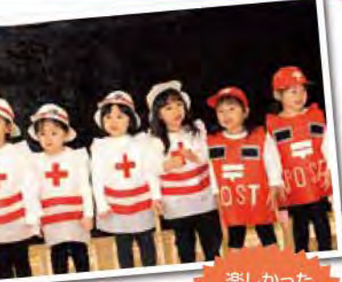
楽しかった 発表会!