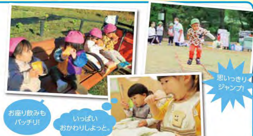
お座り飲みも パッチリ!

人見知りやママ、パパを追って泣いていた0歳児さん。今では、保育者と手繋ぎ歩きも出来るようになりお外が大好きです。保育者に抱っこ抱っこと離れられなかった1歳児さん。自分を主張することも上手になり、ノリノリで踊ったり、ご飯も一人でパクパクと食欲旺盛。パワー全開で何でも挑戦の2歳児さん。お友だち同士のやりとりの中で益々会話も盛んになり、身体も力もたくましくなりました。今もまだまだ成長まっしぐら! みんなの笑顔が元気の源です。1年間ありがとう!