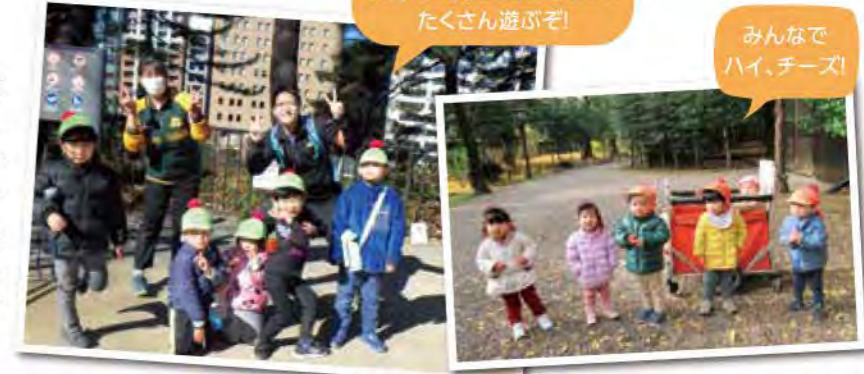
大好きな先生とお友だちと たくさん遊ぶぞ!

少しずつ温かくなり、1年前ドキドキワクワクしながら新年度が始まった時のことを思い出します。少し不安な気持ちの中、印象に残っているのが子どもたちの「笑顔」でした。この1年大変なこともあったけれど、一人ひとりの笑顔に励ましてもらってきました。いつの間にか、どの場面も楽しかった思い出でいっぱいです。みんな、ありがとう! これからも素敵な時間を一緒に過ごしていこうね! みんなの笑顔がいつまでも輝いていますように。