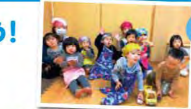
おにぎり 作ったよ☆

入園したときは泣いていたお友だちも今ではニコニコ笑顔で元気いっぱい保育園に来てくれて嬉しかったよ。この1年でできるようになったことがたくさんあったね。たくさんの笑顔や元気をもらったよ。一緒に遊んでくれてありがとう! たくさんハグをしてくれてありがとう! かわいい笑顔を見せてくれてありがとう! 給食をモリモリ食べてくれてありがとう! ありがとうの気持ちでいっぱいです。みんなのことが大好きだよ~☆☆