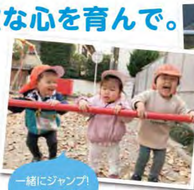
一緒にジャンプ！ 一緒に笑顔！

子どもたちは『人』が大好き。お友だちだけではなく公園で出会った他園のお友だちや保育者、初めて会った保護者の方ともすぐに仲良くなります。広い公園やお部屋の中で遊んでいる時もなぜか集合してしまい「せまいよ」となることも。おもちゃや場所、そして保育者のお膝の取り合いで泣いてしまうこともありましたが、それでもいつも近くで一緒に遊んでいました。そんな『人』を大好きになってくれた子どもたち。その素敵な気持ちは、人を思いやる優しさになることでしょう。大好きなみんな、1年間ありがとう！