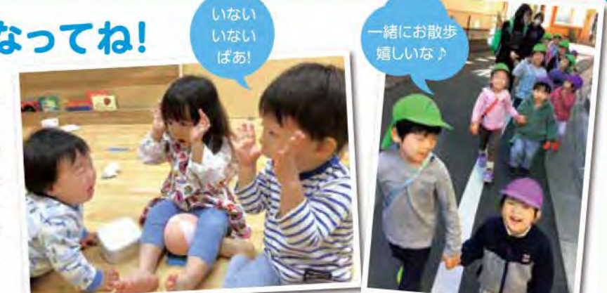
いない いない ばあ!

4月当初は新しい環境に戸惑う子が多かったですが、様々な人との関わりや活動を通してどの年齢の子も成長が見られました。その中で特に感じたのは異年齢児との関わりの中で乳児も幼児もお互いに刺激を受け、幼児は小さい子のお世話を喜び、乳児は様々な人に慣れ、自分が優しくしてもらったように年下の子に優しく接する様子も見られます。子どもたちの素直さや思いやりの気持ちを伸ばしていきたいと思います。みんな優しい気持ちをありがとう!