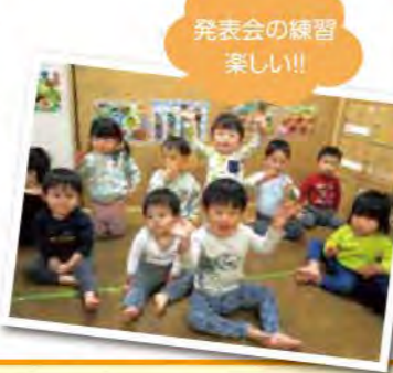
発表会の練習 楽しい!!

コロナウイルスが五類に移行になり、マスクを取ってみんなの笑顔を見ることが出来てとてもうれしかったです。水遊び、七夕まつり、運動会、いも煮会、クリスマス会、発表会とみんなの思い出がたくさんできました。行事を通して他クラスとの関わりの中で、教えてあげたり、手伝ってあげたり、協力したり、とても素敵な姿を見ることが出来ました。みんなの成長を近くで見ることが出来てうれしいです。これからも楽しい時間を一緒に過ごしましょう。みんないつもありがとう!!